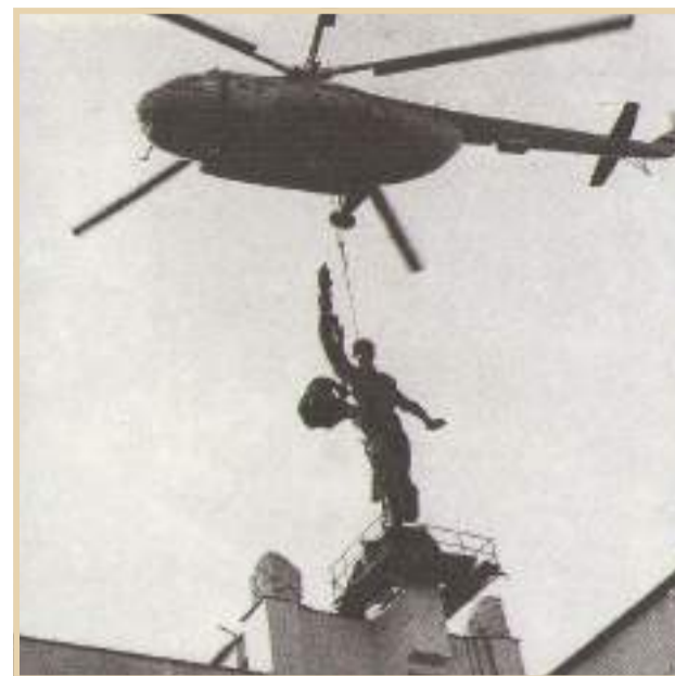
Апрель 1983 г. Установка скульптуры Ники на здании театра